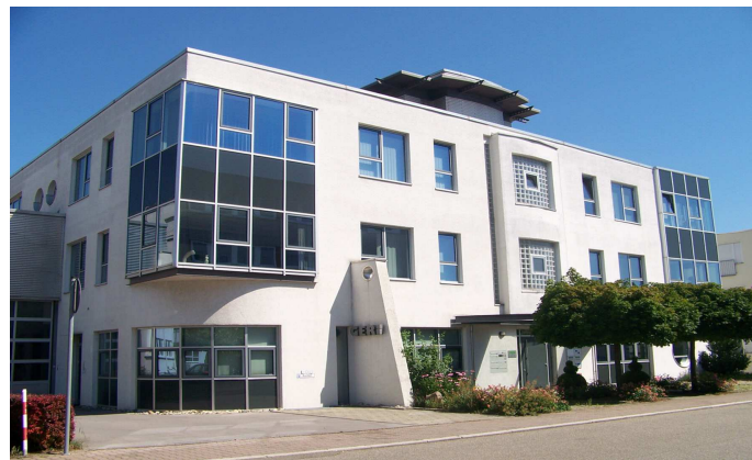
Nieuwe vestigingsplaats/hoofdkantoor AVA Deutschland GmbH in Gerlingen vanaf mei 2010

Begin mei verhuist de verkoopafdeling van AVA Deutschland GmbH van Berlijn naar het hoofdkantoor in Gerlingen en wordt er een single order management-centrum ingericht. Eind mei wordt de voorraad in Gerlingen gecentraliseerd. Het marktaandeel van de thermische producten van het bedrijf ligt op de Duitse IAM (onafhankelijke aftermarket) rond 10 - 12%. Een verdere aankoop van marktaandelen ligt niet in de planning. We richten ons op interne ontwikkeling en groei door ons te concentreren op de sterkste aankopen. De combinatie van de merken GERI en AURADIA onder de merknaam AVA Quality Cooling vloeit samen met de complete organisatorische integratie van de bedrijven.