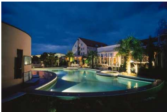
Lindner Hotel & Spa

In samenwerking met KRAFTHAND, het populaire servicecentrummagazine, heeft AVA Deutschland een verloting georganiseerd. De hoofdprijzen zijn: 3 x een weekend voor twee personen in Hockenheim/Speyer. In Hockenheim wordt er geracet in vier verschillende klassen tijdens het ADAC Masters Weekend en u vindt culturele evenementen en ontspanning in het Lindner Hotel & Spa in Speyer.